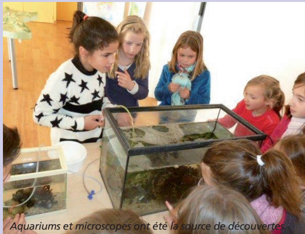
Aquariums et microscopes ont été la source de découvertes

Grâce au SIVALODET et à l'association Cap vers la nature, ils ont tous pu découvrir le bassin versant de l'Odet, depuis sa source à Saint-Goazec jusqu'à l'embouchure de l'Odet sur Clohars-Fouesnant. Une maquette, impressionnante par sa taille, a permis à tous de mieux connaître la géographie du territoire, les différents usages de l'eau, l'importance de sa qualité, la découverte des différents