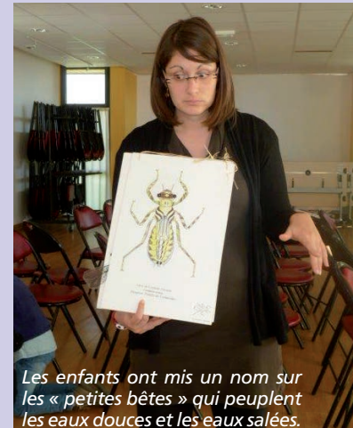
Les enfants ont mis un nom sur les « petites bêtes » qui peuplent les eaux douces et les eaux salées.