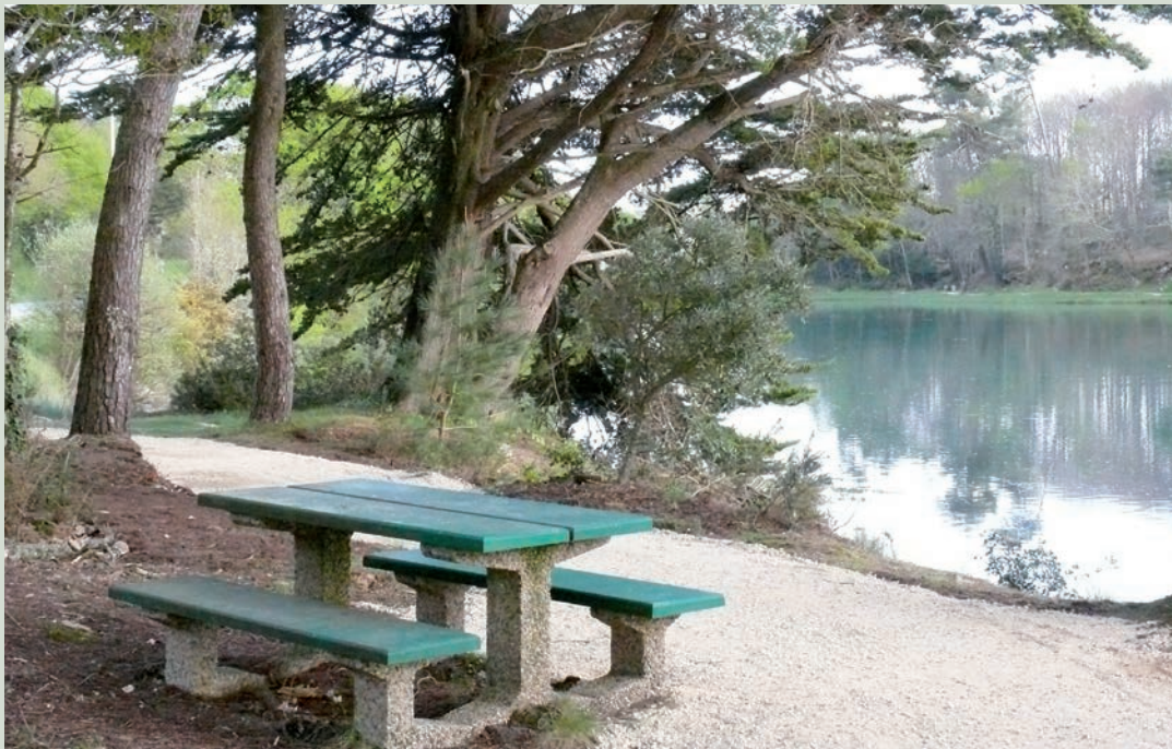
Le chemin piétonnier qui permet d'accéder au gîte de Beg ar vir a été élargi et le passage le long de la route sera bientôt sécurisé par des barrières.

Si le nid est bien celui de cette espèce invasive, il sera détruit et les frais seront pris en charge par la communauté des communes du Pays Fouesnantais.