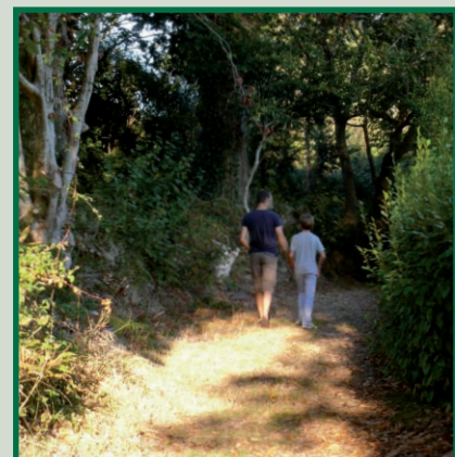
Sentier vers Cheffontaines

D'ici là, bonne promenade en pays cloharsien.