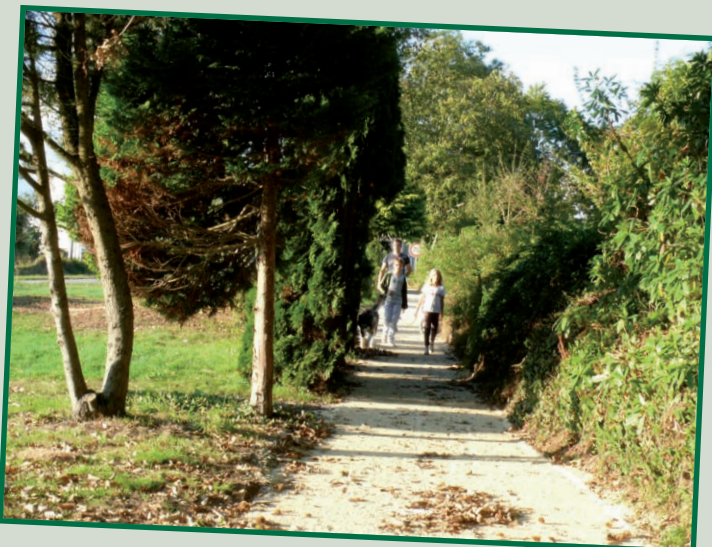
Chemin du Drennec

Désormais, ce tronçon est parfaitement intégré à une boucle des chemins piétonniers de la CCPF. Ce circuit passe par l'allée Vibert, la route de Kérangouic et rejoint la commune de Pleuven.