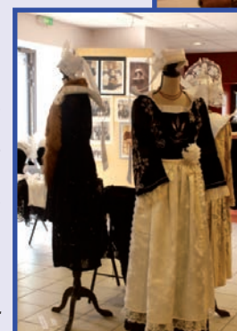
Les costumes et les coiffes du cercle Kollorien de Bénodet.