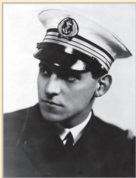
Honoré d'Estienne d'Orves à 30 ans

Au moment de mourir il va pardonner à ses bourreaux et demander à ne pas avoir les mains liées ni les yeux bandés. Il va devenir un symbole de la Résistance, celui du « premier martyr de la France libre ».