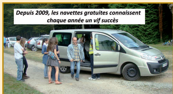
Depuis 2009, les navettes gratuites connaissent chaque année un vif succès

A noter aussi l'ouverture du Domaine de Squididan et les diverses manifestations estivales qui s'y sont déroulées (concours de peinture, expos, théâtre, spectacles...).