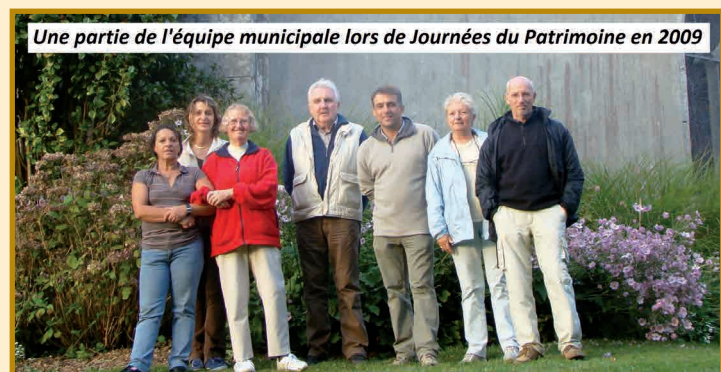
Une partie de l'équipe municipale lors de Journées du Patrimoine en 2009

Aide à l'information : développement de la signalétique concernant les entreprises, commerces, lieux dits, bâtiments d'utilité publique, complété, à la demande de la Poste, par les modifications de noms de rue et d'adresse.