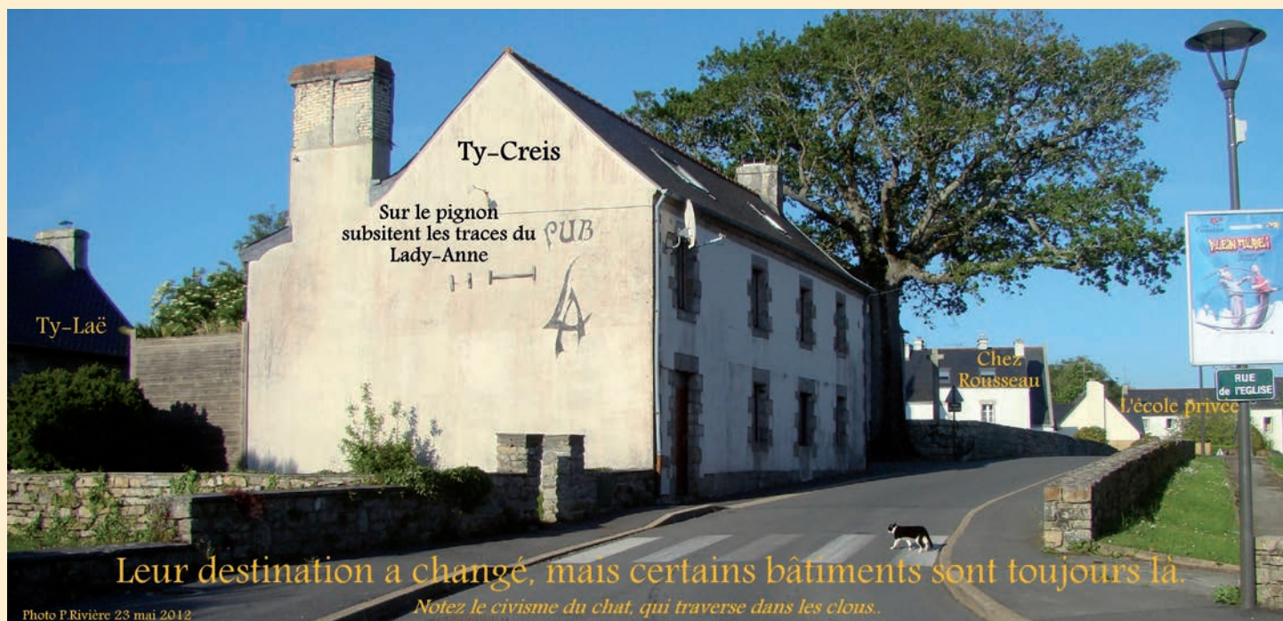
Leur destination a changé, mais certains bâtiments sont toujours là.