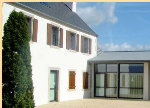
Le presbytère, aujourd'hui intégré à la salle socioculturelle.

voulait. Pour beaucoup, dans nos campagnes, l'instruction ne semblait pas être une priorité et dans l'ensemble on estimait qu'elle devait être du ressort de l'église. Une phrase, relevée dans une délibération du conseil de St-Evarzec en 1851, résume cet état d'esprit : « ... que l'instituteur le plus utile aux intérêts, tant spirituels que temporels de la commune, doit être un ecclésiastique. » D'ailleurs la loi Guizot permet à la commune qui le désire (et qui en a les moyens) de « satisfaire à ses obligations en subventionnant une école confessionnelle ». Beaucoup le feront grâce à de généreux mécènes. Enfin, malgré l'aide possible de l'Etat, les charges induites (construction et entretien du bâtiment, mais aussi traitement de l'instituteur) étaient très lourdes pour les petites communes, souvent pauvres, et déjà très endettées, comme Clohars ! (Notamment à cause du presbytère, qui fut construit très rapidement - 1840- sans aucune polémique, et avec un gros emprunt !) Il faudra 23 ans de palabres (dont 16 pour se mettre d'accord sur le partage du legs entre les deux édifices à bâtir !) avant que l'école n'ouvre ses portes... et autant pour que l'entrepreneur soit payé** !