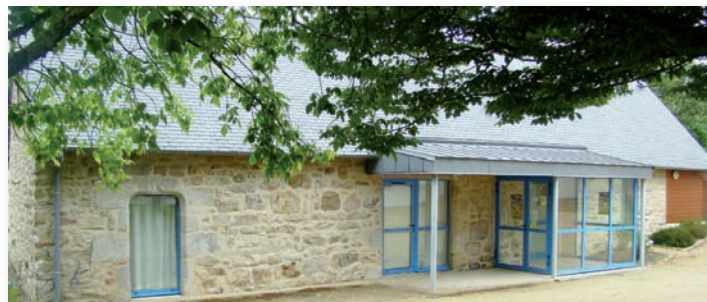
Le seul bâtiment restant du legs initial. Restauré, il abrite la bibliothèque.

cette fin de 19ème siècle, à Clohars comme ailleurs, les préoccupations environnementales, (et le vocabulaire qui va avec) soient totalement inexistantes, on a presque envie de parler de « développement durable » !