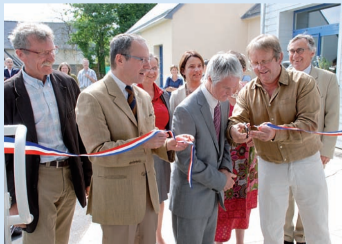
Inauguration en présence du maire, du préfet, et de la conseillère générale.

Les personnes hébergées travaillent au sein de l'ESAT (Etablissement et Service d'Aide par le Travail) géré par le Caillou blanc. Cette activité leur permet de s'intégrer socialement et de s'épanouir par leur travail dans les secteurs de la menuiserie, de la cuisine, du jardinage et des espaces verts. C'est ainsi que l'atelier « cuisine » prépare environ 50 repas/jour pour tous les membres de la communauté.