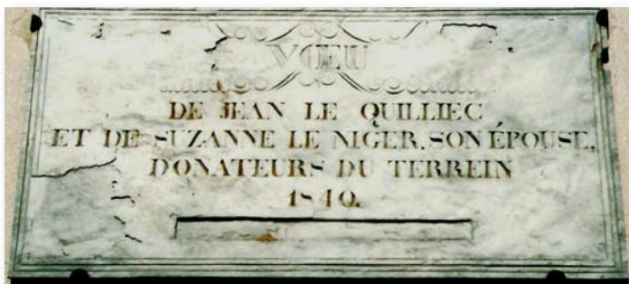
La plaque du presbytère (notez l'orthographe) ; curieusement jamais rien ne fut apposé sur l'école.