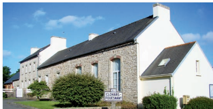
La partie primitive de l'école, avec sa dernière extension (bois) à l'extrême gauche

Aujourd'hui, et depuis longtemps, l'annexe a changé de vocation, l'étable est devenue cuisine, le lieu de décharge a disparu, et, 130 ans après, elle vient d'être, à son tour...annexée !