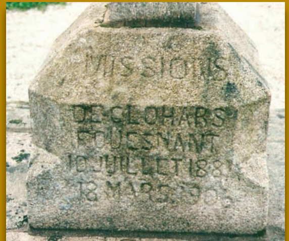
La face ouest du socle, encore lisible (photo 2002)

et désigné par ses collègues pour un nouveau mandat, il refusera pour raison de santé. Il restera conseiller municipal jusqu'en 1945, année où il décèdera, à l'âge de 80 ans. Homme d'une grande foi et de convictions, ses prises de positions, très marquées, en faveur du maintien à Clohars de l'école des sœurs, (loi Waldeck-Rousseau, 1901) et contre l'arrivée de celle de la République, « skol an diaoul » (l'école du diable) lui occasionneront quelques déboires avec la préfecture : contraint à la démission en 1902, il verra même son élection invalidée en 1903 !