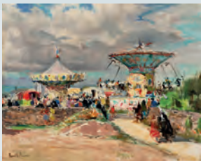
Les manèges ou La fête foraine Émile Simon, 1940, huile sur toile.