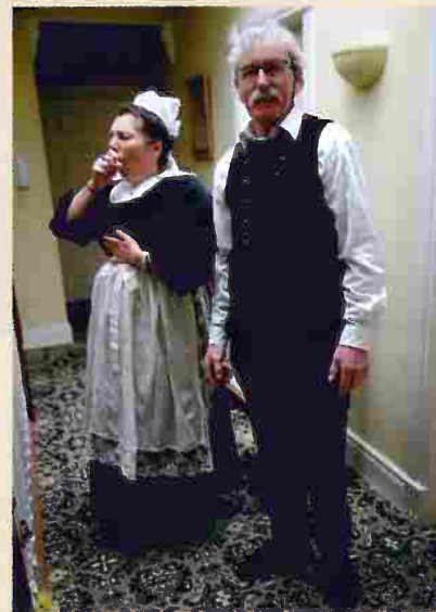
Les costumes cloharsiens ont fait le voyage jusqu'à Oranmore, eux aussi !