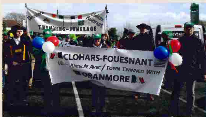
Le comité de jumelage a honoré le blason de Clohars-Fouesnant sur le défilé de la St Patrick en Irlande.