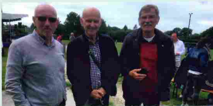
Le club de foot, parrainé par Dan Ar Braz, a remis un chèque de 5.739 euros à l'association Entraide Cancer grâce à la journée de gala organisée en juin.