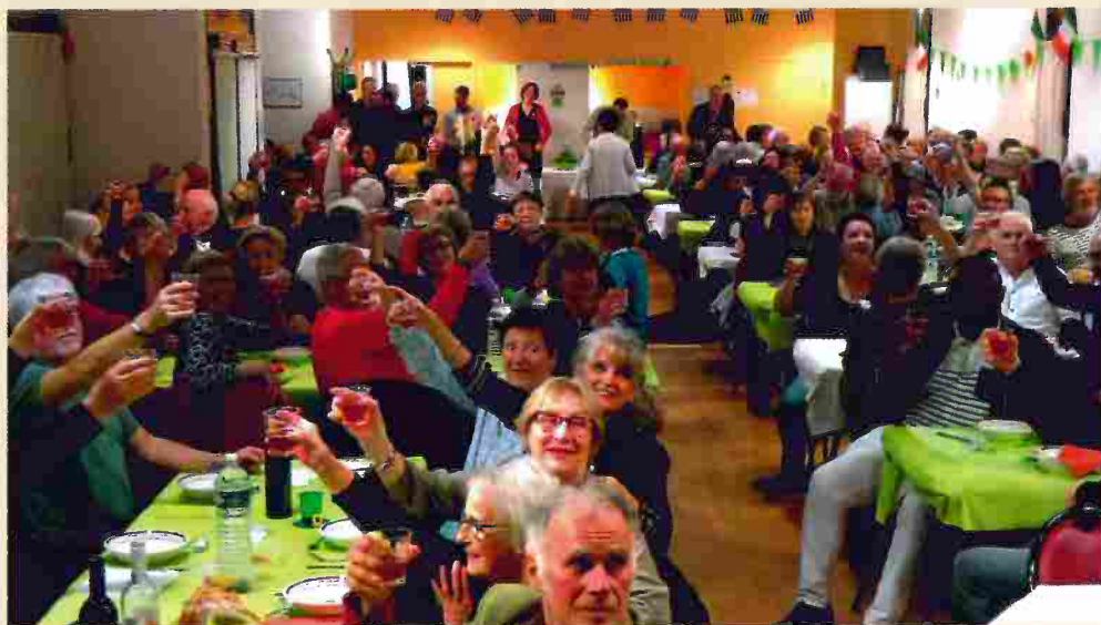
Une salle socioculturelle pleine à craquer pour fêter la St Patrick en mode irlandais.