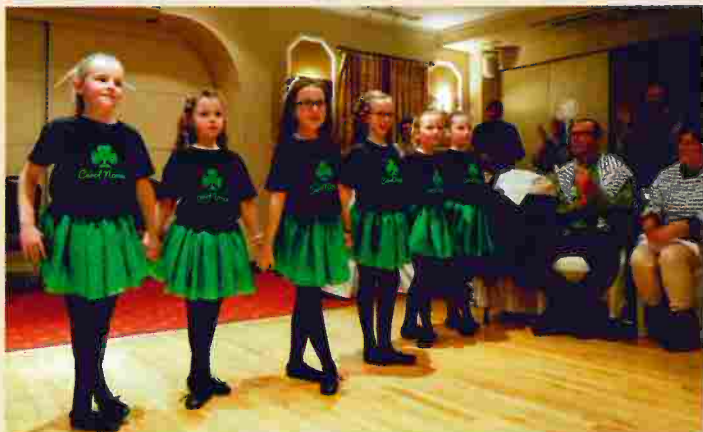
L'école de danses irlandaises a présenté un spectacle avec ses jeunes élèves.