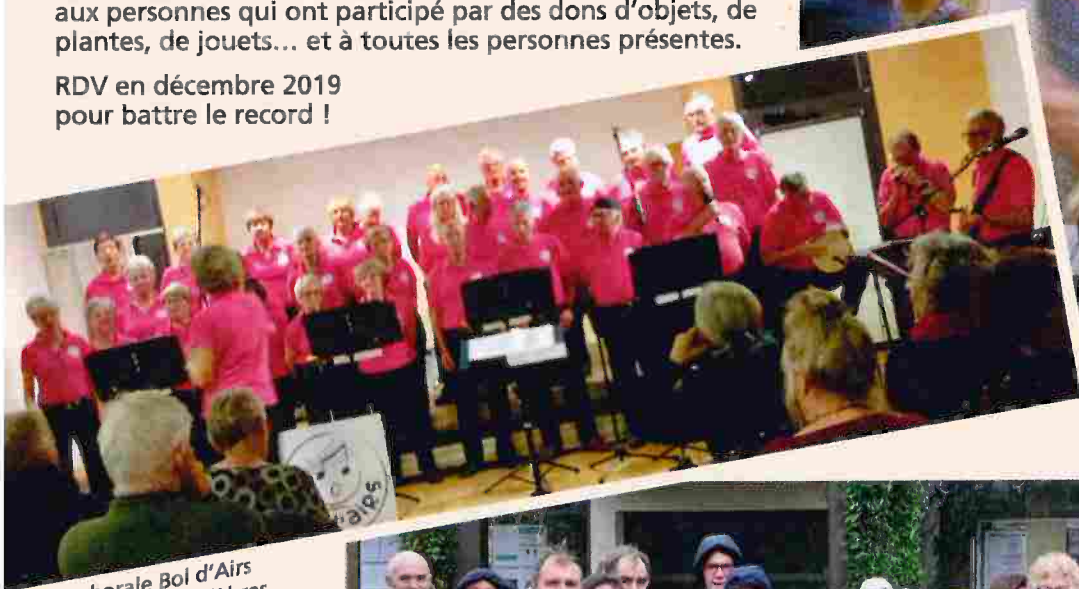
La chorale Bol d'Airs a entamé ses célèbres chants de marins dans la salle socioculturelle.