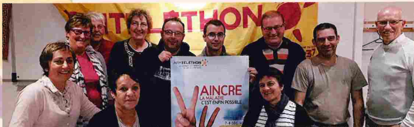
Les associations de Clohars ont concocté un programme joyeux et gourmand.