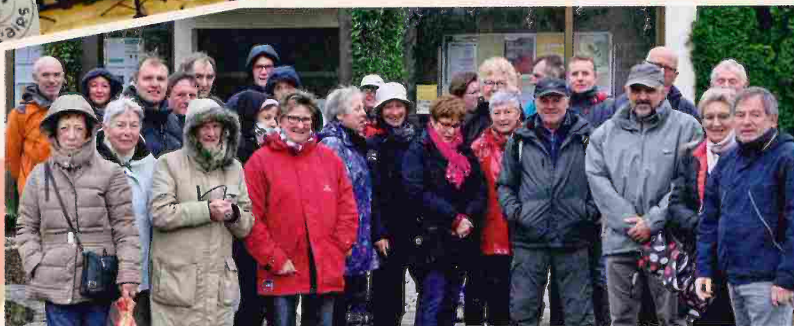
Les bénévoles ont bravé la météo pour accueillir les donateurs