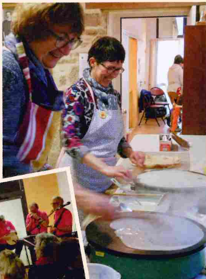
Les crêpières ont régalé les gourmands et réchauffé les cœurs.

RDV en décembre 2019 pour battre le record !